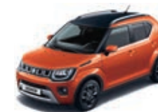
FLAME ORANGE PEARL MÉTALLISÉE