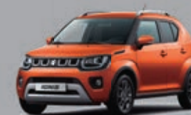
FLAME ORANGE PEARL MÉTALLISÉE