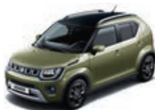
TOUGH KHAKI PEARL MÉTALLISÉE