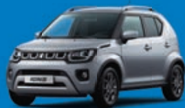
PREMIUM SILVER MÉTALLISÉE