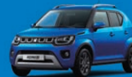
SPEEDY BLUE MÉTALLISÉE