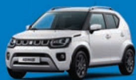
PURE WHITE PEARL