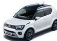
PURE WHITE PEARL