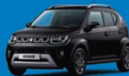
SUPER BLACK PEARL