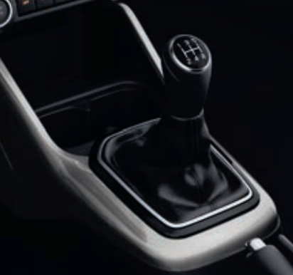
Boîte de vitesses manuelle (5 rapports)

La conduite est fluide et reposante, l'impact environnemental est réduit.