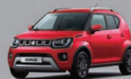
BURNING RED PEARL MÉTALLISÉE