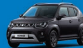
MINERAL GRAY MÉTALLISÉE