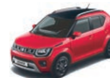
BURNING RED PEARL MÉTALLISÉE