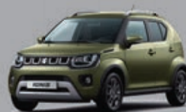
TOUGH KHAKI PEARL MÉTALLISÉE