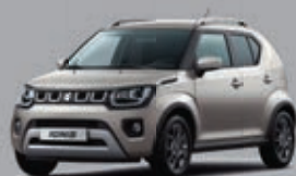
CARAVAN IVORY PURE MÉTALLISÉE