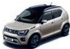
CARAVAN IVORY PURE MÉTALLISÉE