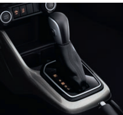
Boîte de vitesses automatique (CVT)

Selon vos préférences, la Suzuki Ignis Hybrid peut être équipée soit d'une boîte de vitesses manuelle à 5 rapports, soit d'une boîte automatique CVT. Quel que soit votre choix, ces deux solutions technologiques sont synonymes de plaisir et de sobriété.